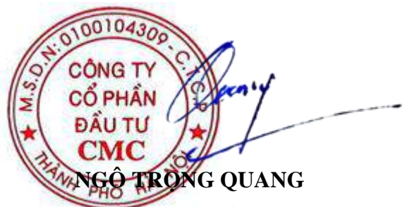
NGÔ TRỌNG QUANG