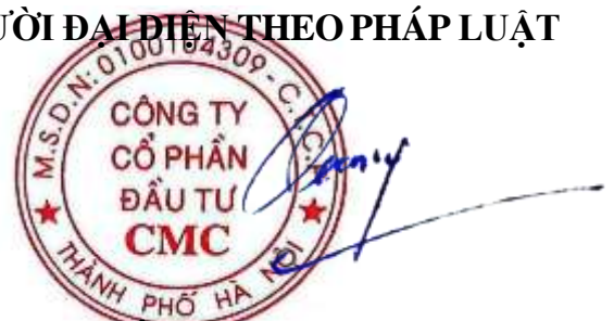
NGÔ TRỌNG QUANG