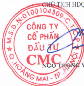
NGÔ TRỌNG VINH